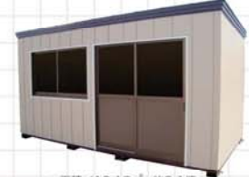
31型 面積/10.13㎡、約3.1坪 Size/W4,500×D2,250