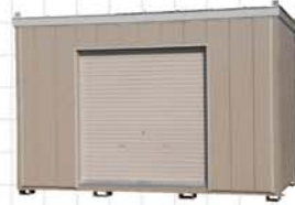
20型 面積/6.75㎡、約2坪 Size/W3,650×D1,850