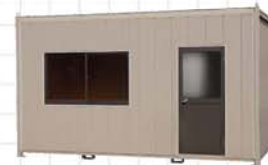
31型 面積/10.24㎡、約3.1坪 Size/W4,550×D2,250