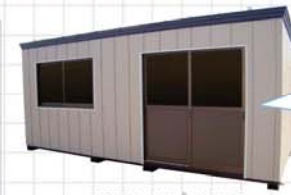
38型 面積/12.15㎡、約3.8坪 Size/W5,400×D2,250