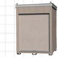
10型 面積/3.42㎡、約1坪 Size/W1,850×D1,850