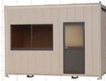
20型 面積/6.75㎡、約2坪 Size/W3,650×D1,850

ニーズにジャストフィットした設計・製造。 耐久性・気密性・経済性を兼ね備えています。