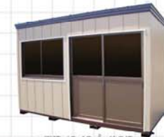
20型 面積/6.48㎡、約2坪 Size/W3,600×D1,800