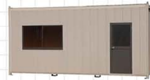
38型 面積/12.26㎡、約3.8坪 Size/W5,450×D2,250